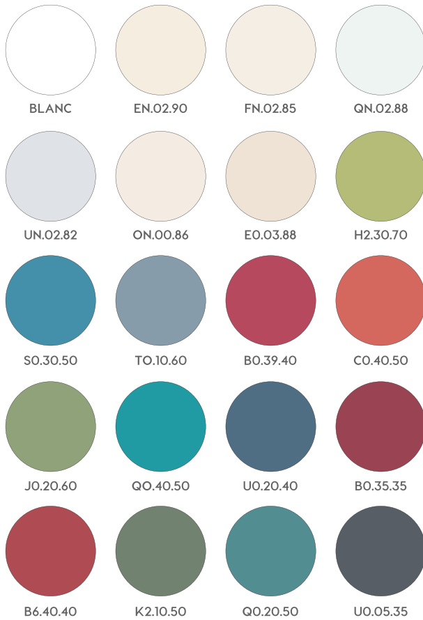
Palette ponctuelle Portes, volets, menuiseries, ferronneries

CONCEPTION : MARTINE HOMBURGER - ARCHITECTE COLORISTE + HÉLÈNE CHARRON - ARCHITECTE ET GRAPHISTE - 2018