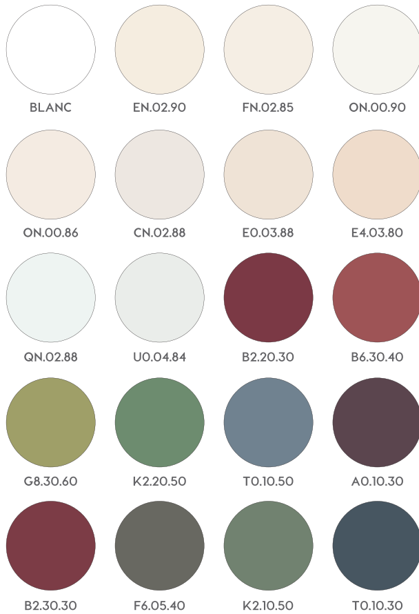
Palette ponctuelle Portes, volets, menuiseries, ferronneries

CONCEPTION : MARTINE HOMBURGER - ARCHITECTE COLORISTE + HÉLÈNE CHARRON - ARCHITECTE ET GRAPHISTE - 2018