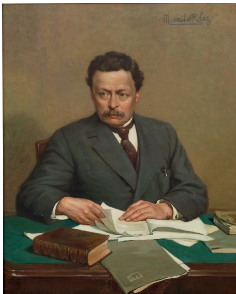
Émilie Rolez, Portrait d'Hippolyte Mars , 1924, Cherbourg-en-Cotentin, musée Hippolyte Mars.

à « l'éducation artistique du peuple », cet élu socialiste a acquis un certain nombre d'œuvres d'artistes locaux pour les présenter au public le plus large possible. Hippolyte Mars souhaitait en effet encourager les peintres cotentinois dont il était proche et acquérir des tableaux « représentant des sites de la localité et des environs ». À travers cette exposition, c'est toute une histoire de la peinture du territoire entre 1900 et 1950 qui est révélée. Jules Georges Moteley, Émile Dorrée, Pierre Campain, Édith Faucon, Émilie Rolez mais aussi des noms peut-être moins connus localement tels que William Didier-Pougnet et Georges Guinegault sont ainsi représentés.