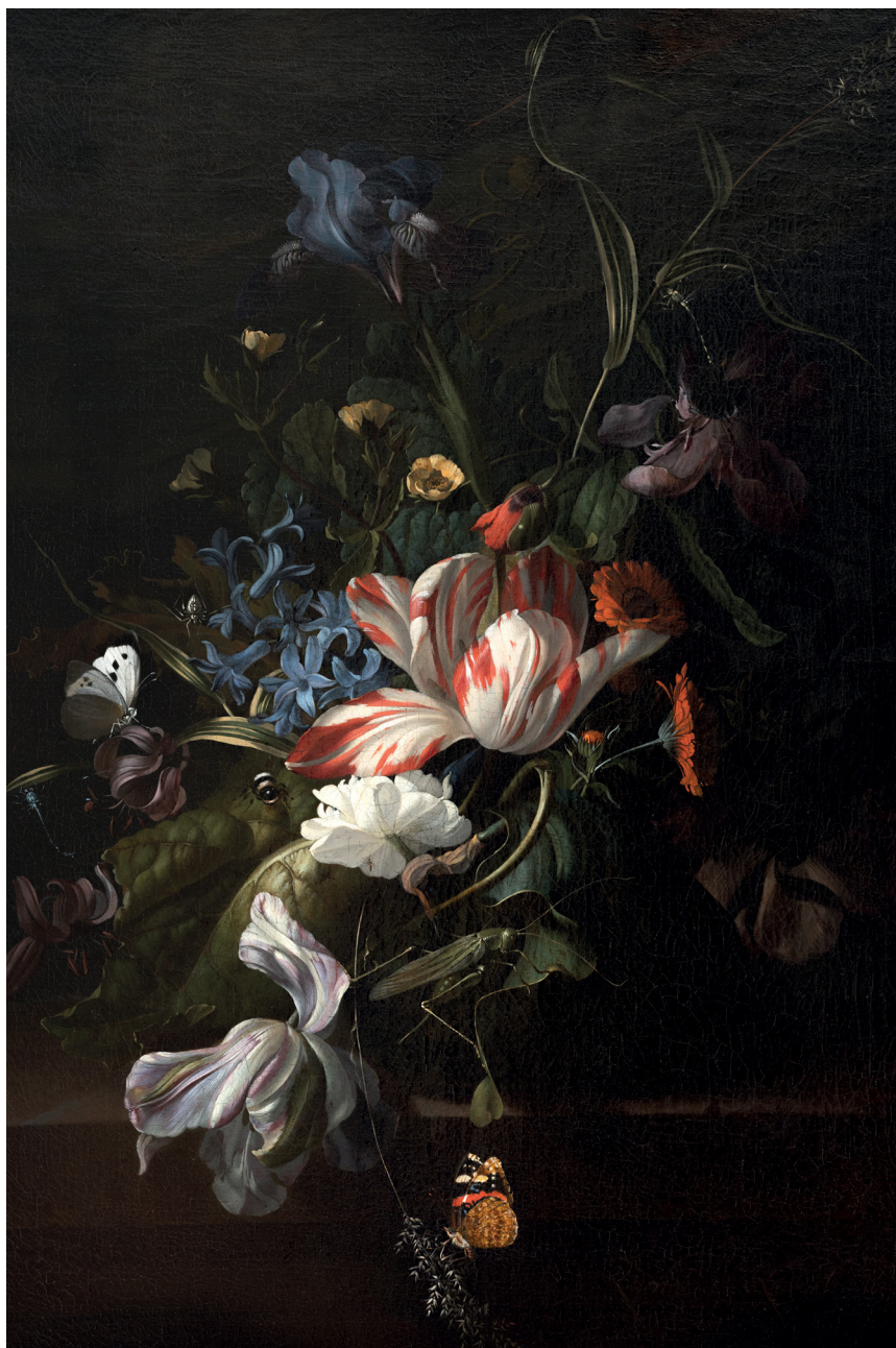
Rachel Ruysch, Fleurs, huile sur toile maroufée sur bois, 1696, Cherbourg-en-Cotentin, musée Thomas Henry.