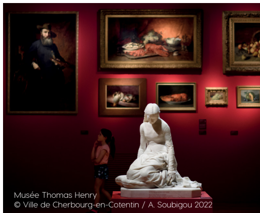
Musée Thomas Henry

Le musée doit son remarquable ensemble de peintures et de sculptures à un homme, Thomas Henry (1766-1836). Né à Cherbourg, Thomas Henry fut l'un des plus grands marchands d'art parisien du début du XIX e siècle. Entre 1831 et 1835, il donne 164 peintures et sculptures à sa ville natale, afin d'y « allumer le flambeau des arts ». Cette donation constitue le fonds premier du musée.