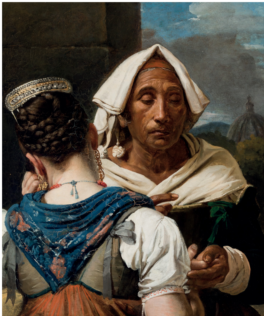
Jean-Victor Schnetz, La Diseuse de bonne aventure , vers 1820, Clermont Auvergne Métropole, musée d'art Roger Quillot © Florent Guiffard.

L'exposition est organisée en coproduction avec le musée du Monastère royal de Brou à Bourg-en-Bresse. Elle bénéficie du label Exposition d'intérêt national du Ministère de la Culture.